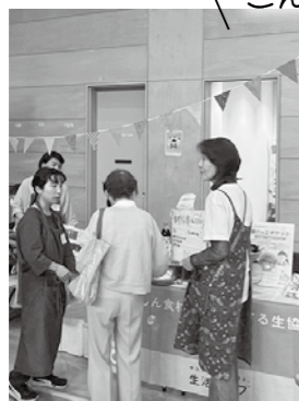
「香料公書」に取り組んでいる南支部地域連絡会。市民ネットは香害アンケートを実施