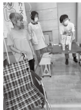
「たすけあいワーカーズ さくらんぼ」は、車いす試乗体験と介護相談

※南支部地域連絡会とは 生活クラブ南支部、市民ネット南、南区のワーカーズが連携をとりながら、地域の課題を解決するための取り組みや活動を行う会