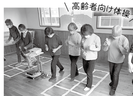
介護予防センターと連携し「ふまねっと運動」も取り入れています