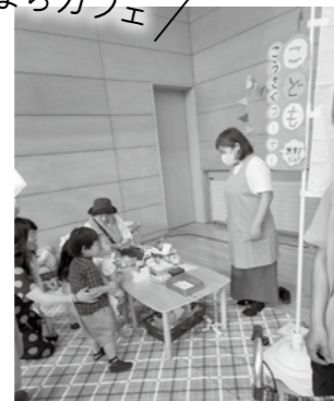
「子育て支援ワーカーズぐるんば」は、ミニワークショップ