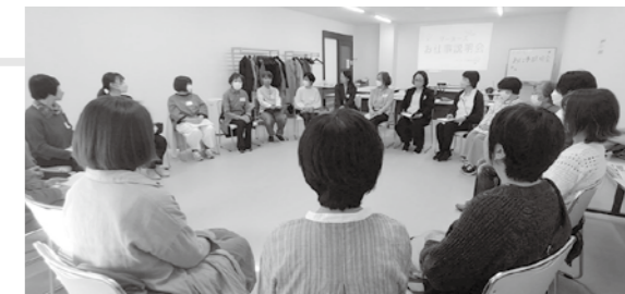
動画上映や体験談、フリートークなど、ワーカーズを身近に感じられる内容を企画 (2023.10 生活クラブ本部)

ワーカーズに興味のある方を対象に開催。団体につながった来場者もあり、働き方を広める良い機会となりました。次回は2025年2月に開催予定。