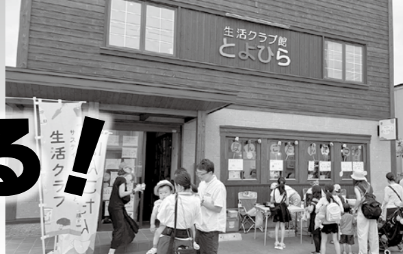
多くの親子連れで賑わった夏まつり (2024.7)

ワーカーズ・コレクティブは、地域に密着して事業をおこなっています。今回は札幌市南区・豊平区・厚別区・清田区、北広島市のワーカーズが地域とつながり、活動している様子を紹介します。