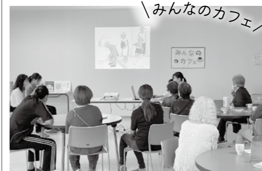
プロジェクターを使った絵本朗読。学生ボランティアによる企画も実施 (2023.9)

訪問ケアのほか、高齢者や障がいのある方の生活に必要な手助けをするデイサービスを運営。